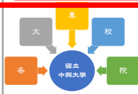
校際選課申請(他校修本校)